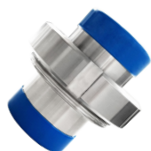
Schroefkoppeling DIN 11864-1 FORM A - Range A