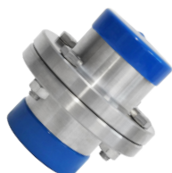
Flenskoppling DIN 11864-2 FORM A - Range A